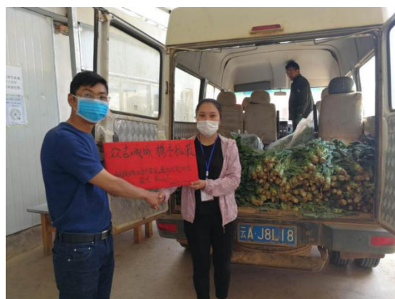
协会向空港重点办项目捐赠蔬菜