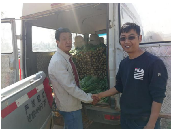
向滇中管委会东区指挥部捐赠蔬菜