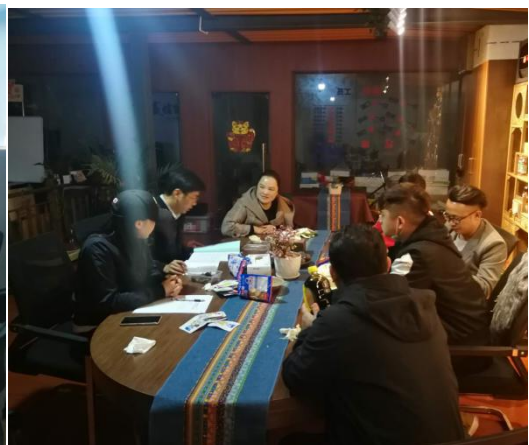
对中标候选人进行实地考察