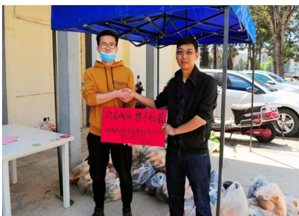
协会向学院教职工捐赠蔬菜

新冠病毒疫情期间,协会积极参与防疫工作,积极助力复工复产,用实际行动向社会各界送温暖、献爱心。