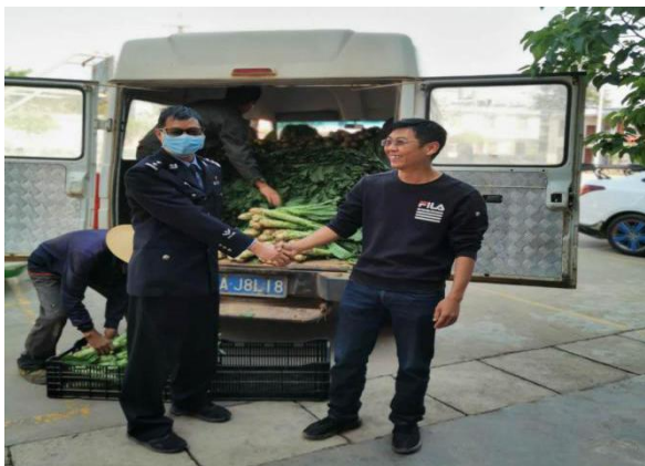
协会向辖区派出所捐赠蔬菜