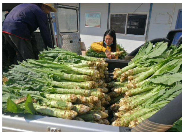
协会向空港消防小哨中队捐赠蔬菜